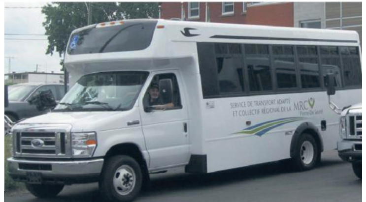
SERVICE DE TRANSPORT ADAPTÉ ET COLLECTIF RÉGIONAL DE LA MRC Pierre-De Saurel

Avec STACR, se déplacer n'est plus un problème de mobilité!